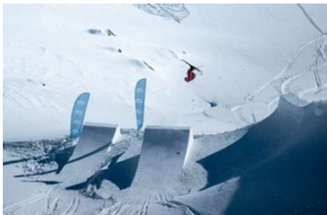
Nendaz Backcountry Invitation