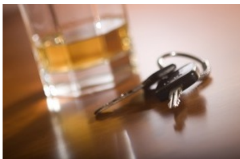
A set of car keys in the foreground and glass of whiskey behind.

Diese Meldung kann unter https://www.presseportal.ch/fr/pm/100000091/100937190 abgerufen werden.