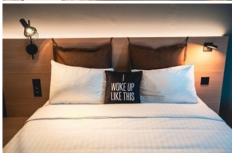
Certaines chambres offrent même une vue directe sur le stade Letzigrund.