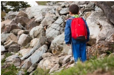
La vie des marmottes - Merci d'indiquer le copyright en cas d'utilisation : Suisse Tourisme