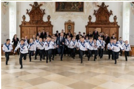
Choeur St Florian de Vienne