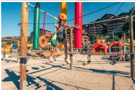
Village de Cheesy - Merci d'indiquer le copyright en cas d'utilisation : Florian Bouvet Fournier