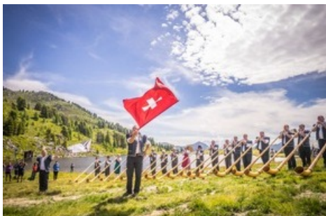
Festival International de cor des Alpes - Merci d'indiquer le copyright en cas d'utilisation : Florian Bouvet Fournier