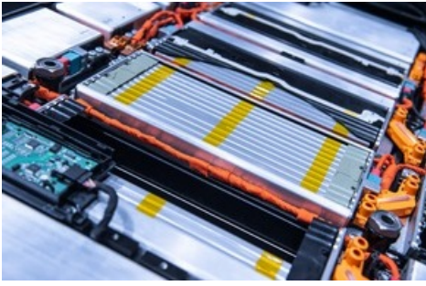
EV car battery pack. Electric car lithium battery pack. Blue toned. Car maintenance

Diese Meldung kann unter https://www.presseportal.ch/fr/pm/100000091/100920593 abgerufen werden.