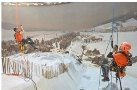
Cordistes lors de travaux d'installation devant le Panorama Bourbaki, janvier 2024.