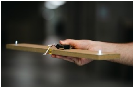
Le panneau à base de bois compte cinq couches.