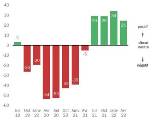
Indice Swissmechanic du climat des affaires pour PME de la branche MEM