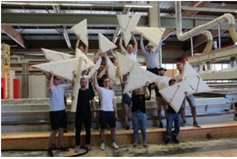
Des étudiant-e-s et des enseignant-e-s fiers de présenter les premiers éléments grandeur nature de *rtbt* ArtBeat.