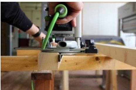
Découper des éléments.