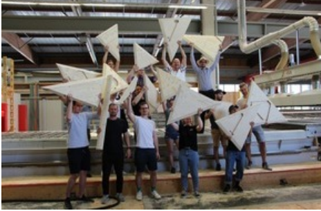
Des étudiant-e-s et des enseignant-e-s fiers de présenter les premiers éléments grandeur nature de *rtbt* ArtBeat.