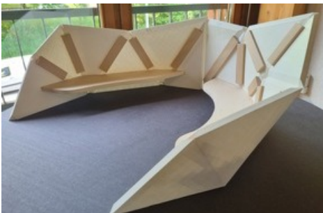
Petit modèle avec banc.