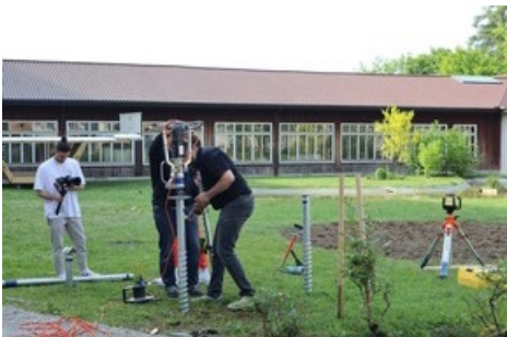
Percer des trous pour la fondation.