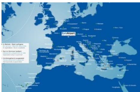
Carte des destinations hiver 2021/2022