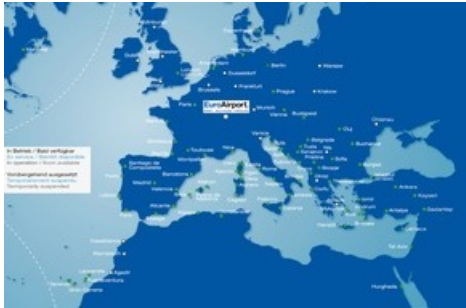
Carte des destinations EuroAirport été 2021

Diese Meldung kann unter https://www.presseportal.ch/fr/pm/100075401/100868694 abgerufen werden.