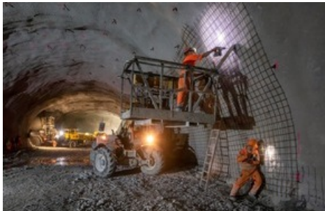
Durant les travaux (S. Irngartinger / BLS).