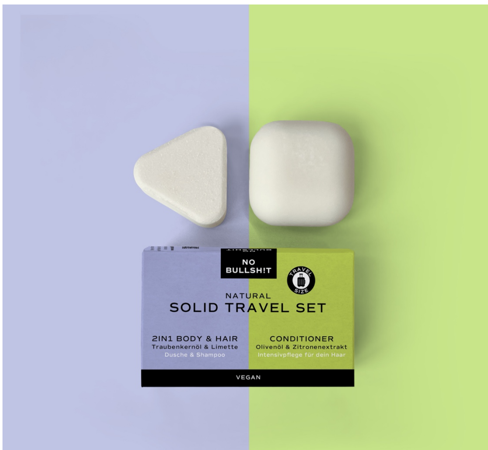
Photo 1 : Voilà comment on voyage aujourd'hui : une petite quantité de produits dure jusqu'à deux semaines.

Aarau, janvier 2024. La marque de produits cosmétiques naturels et durables « No Bullsh!t » lance un nouveau cosmétique solide de voyage sur le marché. La gamme de produits comprend le kit de voyage « Solid Travel Set » conçu tout spécialement pour les voyageurs et composé d'un soin solide 2 en 1 pour le corps et les cheveux et d'un après-shampooing. Tous les produits sont anhydres (exempts d'eau) et donc idéaux lors de tout déplacement. Ces produits innovants sont fabriqués exclusivement à base d'ingrédients naturels et sont unisexes, vegan et durables.