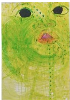
04 Tracey Rose Lala , 2013 Technique mixte sur papier 228 x 150 cm