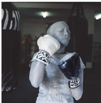
01 Tracey Rose Lovemefuckme , 2001 Impression Lambda 119 x 119 cm

Tous les droits d'auteur sont réservés. La légende doit être reprise intégralement et l'œuvre doit être reproduite telle qu'elle est présentée. Les photos ne peuvent être utilisées que dans le cadre d'un reportage sur l'exposition Tracey Rose. Shooting Down Babylon .