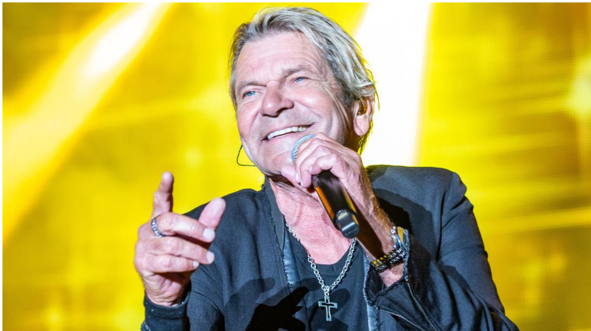
Matthias Reim singt garantiert mehr als «Verdammt ich lieb dich» auf dem Zaunplatz in Glarus.