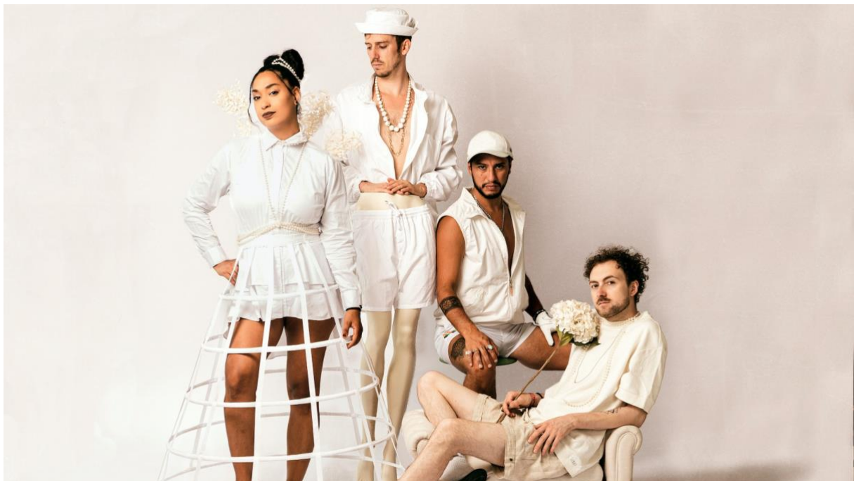
La Nefera steht für ein originelles Line-up, empowernden Rap und unverwechselbare Ästhetik.