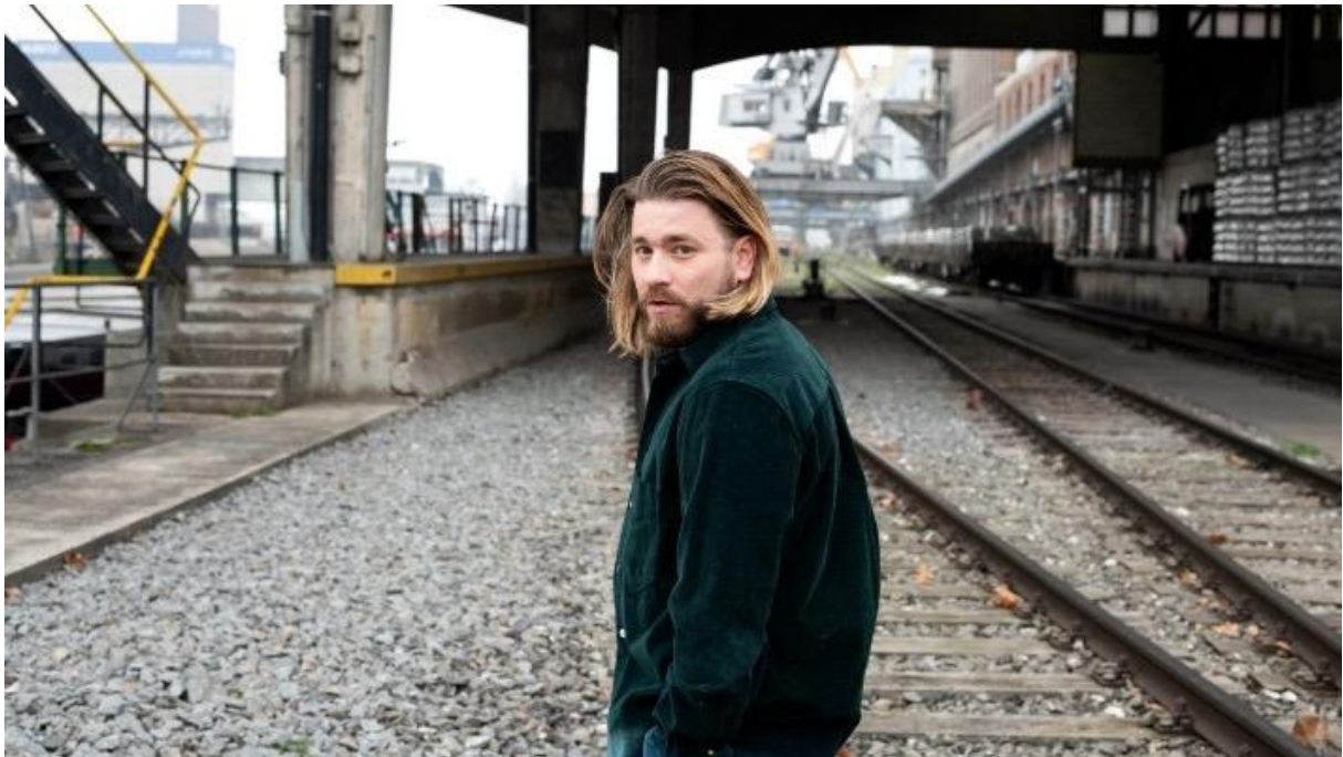
Baschi tunkt ganz ehrlich seinen Pop-Rock in ein melodioses Disco-Bad.