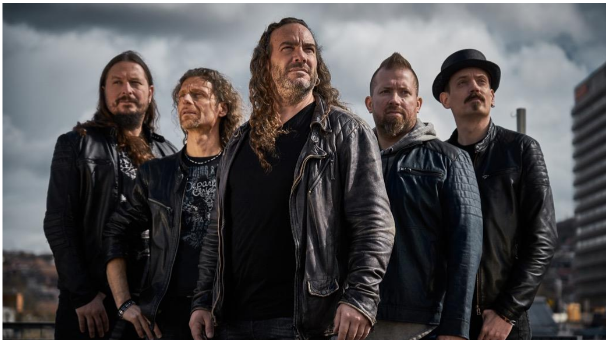
Die Ostschweizer Band Megawatt singt leidenschaftlichen Rock auf Mundart.