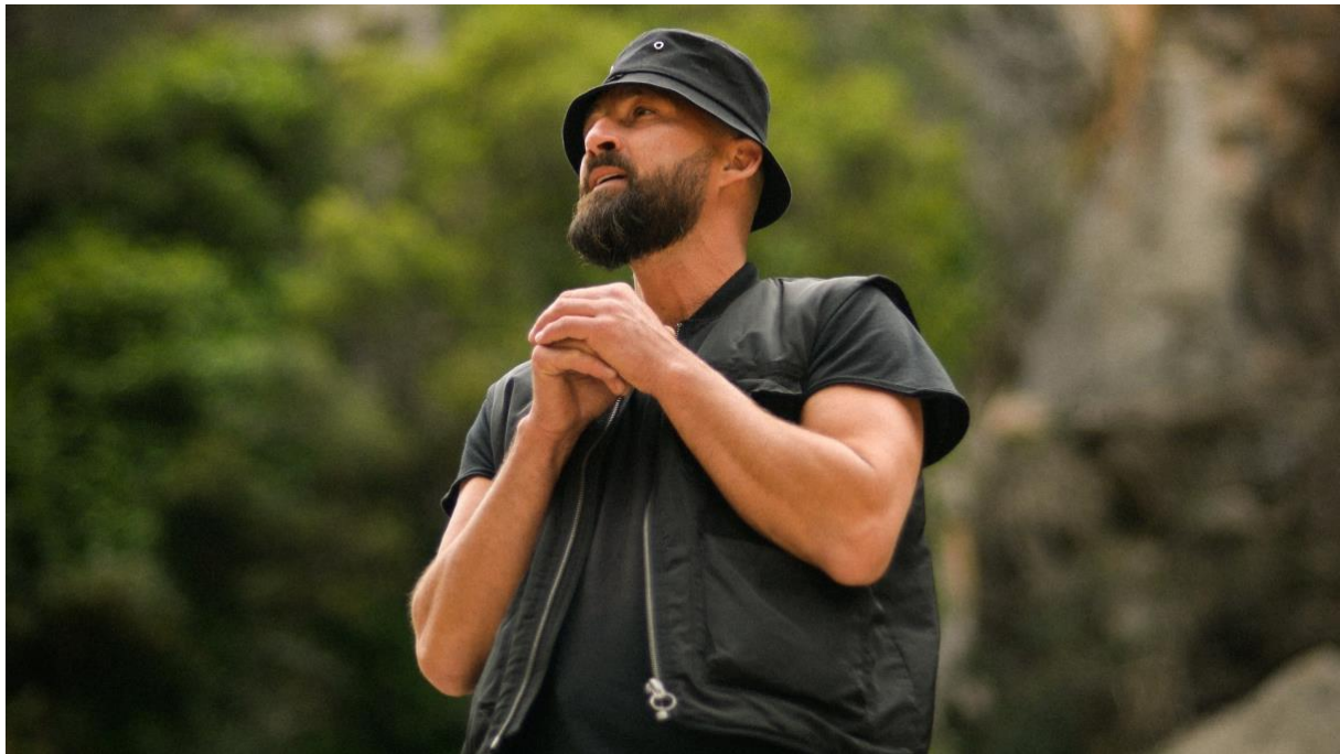
Gentleman behauptet sich und seine musikalische Schlagkraft mit Reggae und Dancehall.