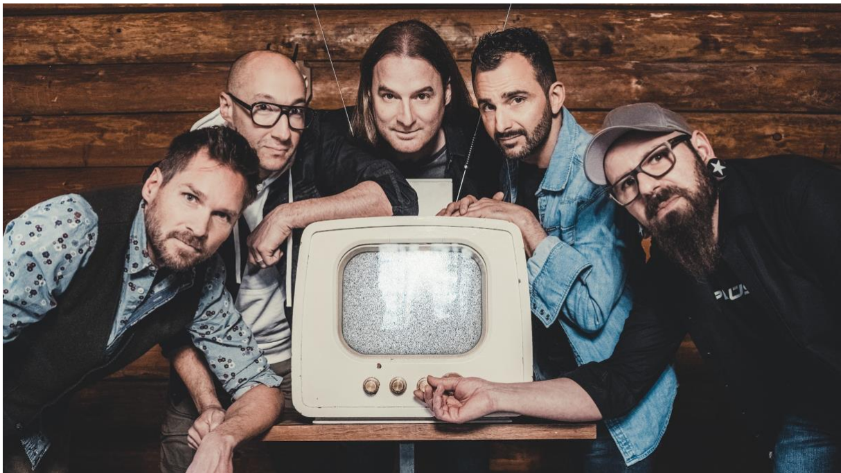
Ritschi, Simi, Hunzi, Bali und Röschel sind als Plüsch wieder auf Tournee.