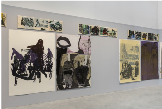
10 Amy Sillman Untitled (Frieze for Venice) [ohne Titel (Fries für Venedig)], 2021 Detail der Präsentation im Zentralpavillon während der Biennale in Venedig 2022 Obere Reihe: 71 Zeichnungen, Acryl, Tusche, Aquarelle und Bleistift auf Papier 28,9 x 36,2 cm Untere Reihe: 68 Zeichnungen, Acryl, Tusche, Aquarell und Bleistift auf Papier, montiert auf Tafeln 190,5 x 167,6 cm