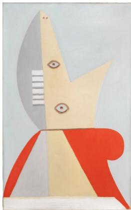
11 Pablo Picasso Tête de jeune fille , 1929 Öl auf Leinwand 61 x 38 cm Kunstmuseum Bern, Hermann und Margrit Rupf-Stiftung 2023, ProLitteris, Zurich