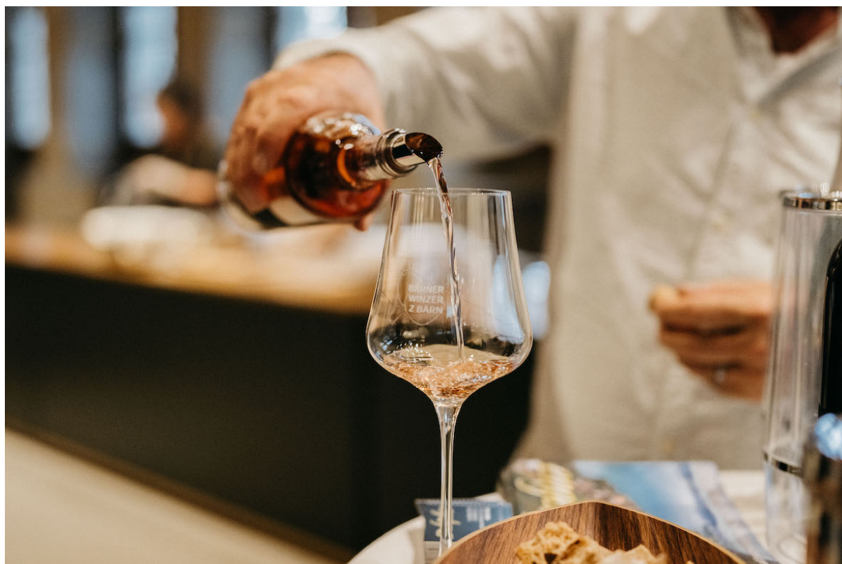
Bild 1: Zwei Dutzend Winzerinnen und Winzer aus zwei Berner Weinbaugebieten boten jeweils drei ihrer Weine zur Degustation an.

Bern, 8. November 2023. Im ehrwürdigen Berner Rathaus boten am Donnerstag, 2. November, zwei Dutzend Winzerinnen und Winzer aus dem Kanton Bern jeweils drei ihrer Weine zur Degustation an. So soll eine breitere Öffentlichkeit von der Qualität der Berner Weine überzeugt werden.