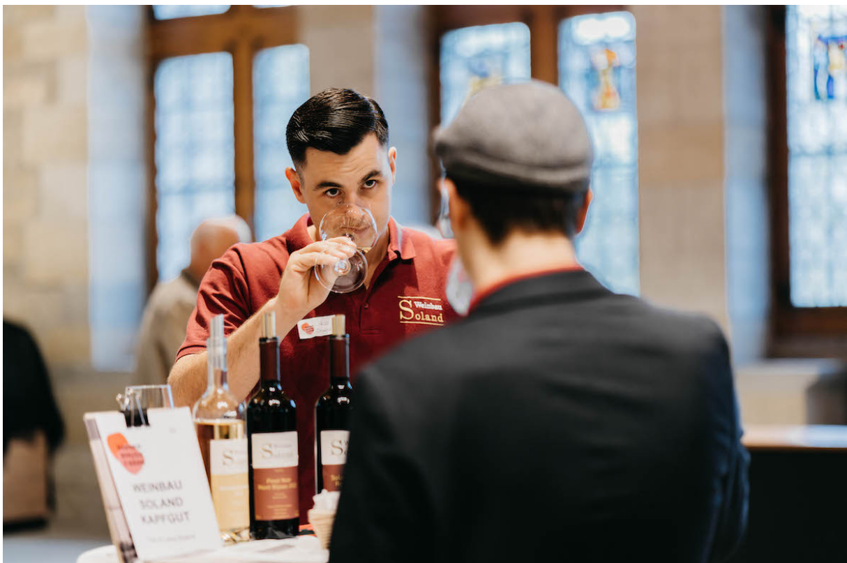
Bild 4: Auf dem Vormarsch sind die PIWI-Sorten, am Bielersee machen sie 6%, am Thunersee mittlerweile 30% der Produktion aus.