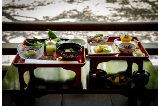
Cuisine bouddhiste au Koyasan Fumon-in, sur le Kumano kodō