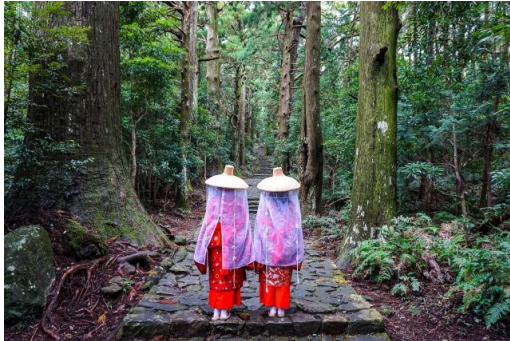
Un des sentiers du chemin de pèlerinage du Kumano kodō