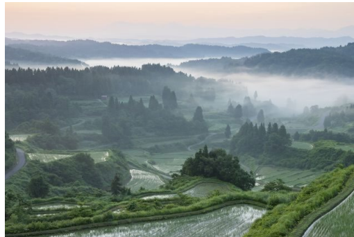
Rizières en terrasses de Tōkamachi dans la préfecture de Niigata