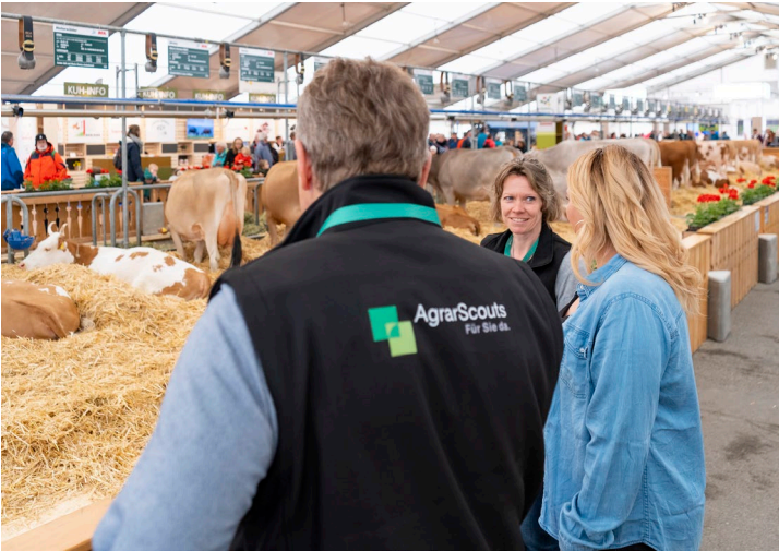
Ein AgrarScout an der BEA im Einsatz