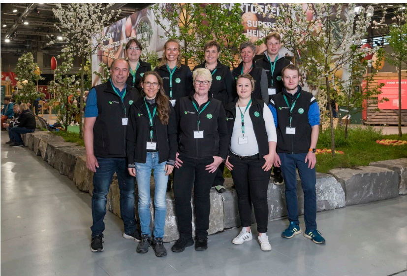
Gruppenfoto der AgrarScouts an der BEA