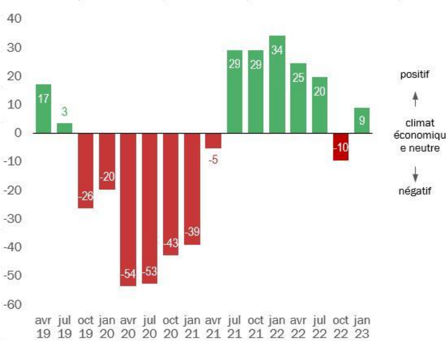
Fig. 2: Indice Swissmechanic du climat des affaires pour la branche PME MEM