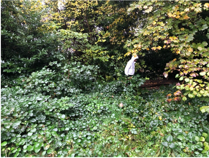
Nino Baumgartner: Shortcuts, Migma Performancetage Luzern, 2022