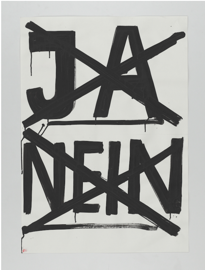
Alex Hanimann: o. T. [ja nein], undatiert, Acryl auf Papier, 83.7 x 59.4