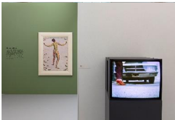
Blicke aus der Zeit, Installationsansicht

Der Schritt ins Bild: Die Ausstellung endet damit, dass die Figur im Bild sich umdreht und den Betrachtenden den Rücken zuwendet. In diesem Moment befinden wir uns in derselben Position wie diese «Rückenfigur», die in die Tiefe des Bildraums schaut. Dort öffnet sich der Blick in eine Landschaft – ausser er ist versperrt durch die Rückwand einer Telefonkabine. Die Augen der Figur im Bild bleiben unsichtbar, unser Blick trifft sich nicht mit ihrem. Aber die beiden werden deckungsgleich, und wir sehen dasselbe.