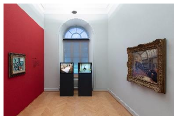
Blicke aus der Zeit, Installationsansicht