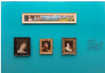
Blicke aus der Zeit, Installationsansicht

Fokus jenseits des Rahmens: Das Gesicht ist abgewendet, die Augen drehen sich weg von den Betrachtenden. Wir sehen sie, doch sie sehen uns nicht. Die Darstellung des Profils oder der ekstatischen Verzückung lässt den Blick die Grenzen von Bildfeld und Bildraum durchbrechen. Unser Blick wird nicht erwidert, wir bleiben ausgeschlossen von der direkten Kommunikation. Der gerichtete Blick und seine Dynamik suggerieren eine Welt ausserhalb des Bildes und führen unseren Blick zurück in den realen Raum.