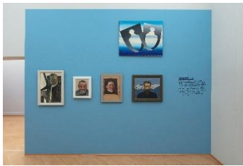
Blicke aus der Zeit, Installationsansicht

Selbstreflexion im Selbstporträt: Kunstschaffende treten sich selbst gegenüber, inszenieren sich in unterschiedlichen Posen, als Künstlerin mit Pinsel und Palette oder als Bürger im Anzug, nachdenklich, existenzialistisch, herrisch-frontal, repräsentativ, exaltiert, frivol... Ihr Blick ist doppelt gerichtet: in den Spiegel und zugleich auf diejenigen, die vor dem Bild stehen und es betrachten. Die Kunstschaffenden selbst sind es, die direkt mit uns kommunizieren. Ihr Blick wird zur individuellen Signatur.