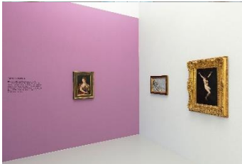
Blicke aus der Zeit, Installationsansicht

Störung des Dialogs: Verschattet, bedeckt, geschlossen – die Augen im Bild verweigern uns den Blick-Kontakt. Oder dieser bleibt umgekehrt ihnen endgültig verwehrt: Der Blick erlischt, zuweilen ist er bereits leer. Die Kommunikation zwischen den Blicken aus dem Bild und unseren Blicken ins Bild ist gestört, unterbrochen oder beendet.