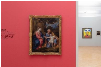
Blicke aus der Zeit, Installationsansicht

Kommunikation im Bild: Ob biblische Historie, zeitgeschichtliches Ereignis, geselliges Stelldichein – stets kreuzen oder treffen sich Blicke innerhalb des Bildes und erläutern die Szenerie. Sie zeigen Richtungen an und umreissen Räume, sie schaffen Beziehungen. Manchmal zieht ein direkter Blick aus dem Bild uns Betrachtende ins Geschehen hinein.