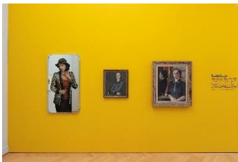
Blicke aus der Zeit, Installationsansicht

Kunstschaffende sehen Kunstschaffende: Als Gegenstück zum Selbstbildnis porträtieren sie Kolleginnen und Kollegen. Sie schauen aufeinander mit geschärfter Aufmerksamkeit: Freund, Partnerin, Konkurrent? Diese Bildnisse sind, anders als Selbstporträts, gefiltert durch einen zweiten Blick. Er erweitert die Konstellation zum Dreieck und öffnet einen visuellen Dialog zwischen Künstlerin, Künstler, Porträtiertes, Porträtiertem und Betrachtenden.