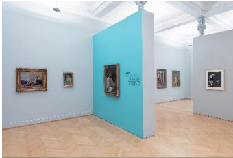
Blicke aus der Zeit, Installationsansicht

Fokus im Bild: Buch, Blume, Schädel sind klassische Objekte der Konzentration, der Versenkung und Meditation. In der Lektüre findet der Blick das sofortige Echo, die Selbstversunkenheit hingegen lässt seinen Fokus verschwimmen. Einmal trifft er konzentriert auf den Gegenstand in der Hand, dann wieder verkörpert der Blick, unbestimmt und bei aufgestütztem Kopf, den Gestus der Melancholie. Die Blick-Distanz ist kurz und bleibt im Bild, aber die Gedanken schweifen frei.