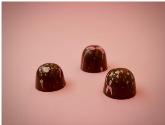
Nur im Hotel Paradies Ftan: Der «Löwen-Kuss» von Löw Delights aus Engadiner Baumnuss und Aroniabeeren.