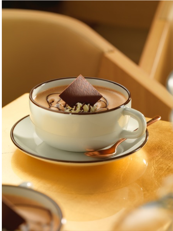
Schokoladenträume werden hier auch in Tassen gefüllt: Der ChocoCino.