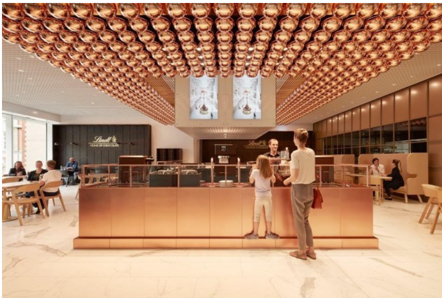
Das neue Lindt Café im Lindt Home of Chocolate ist das erste seiner Art in der Schweiz.

Medienstelle Lindt Home of Chocolate +41 44 716 22 33 | media@lindt.com