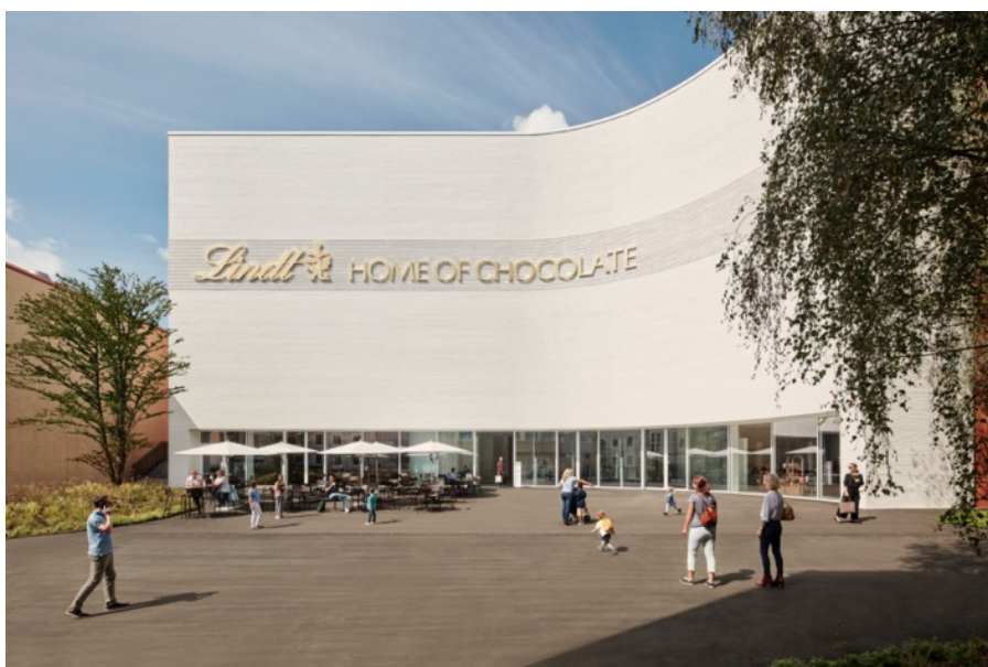
Nebst einem grosszügigem Innenbereich gibt's auch auf der Terrasse herzhafte Köstlichkeiten.