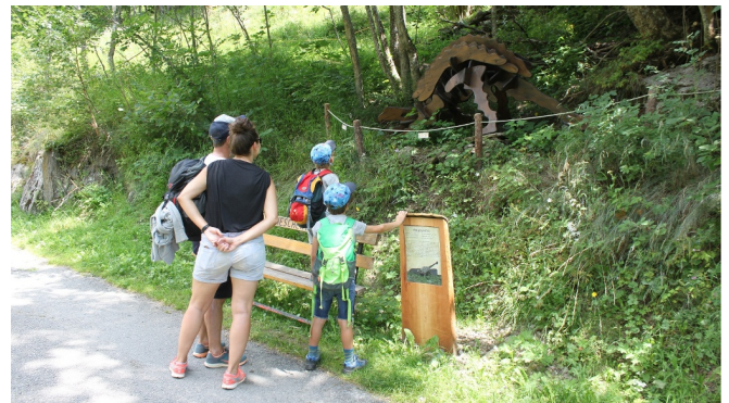
Themenweg Sauriertrail Fieschertal - Feuerstelle Brüchergand - Fieschertal