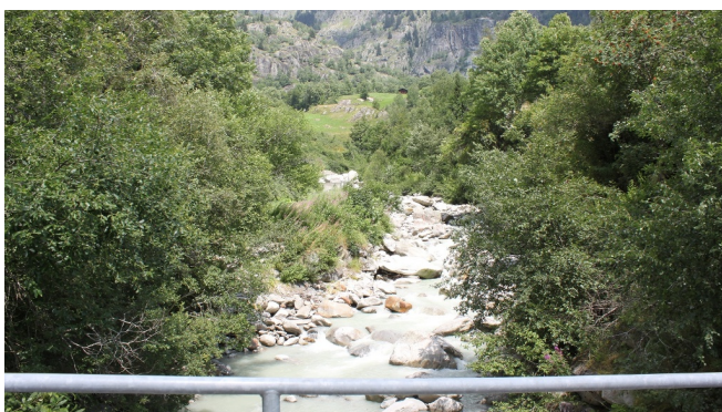
Themenweg Sauriertrail Fieschertal - Feuerstelle Brüchergand - Fieschertal