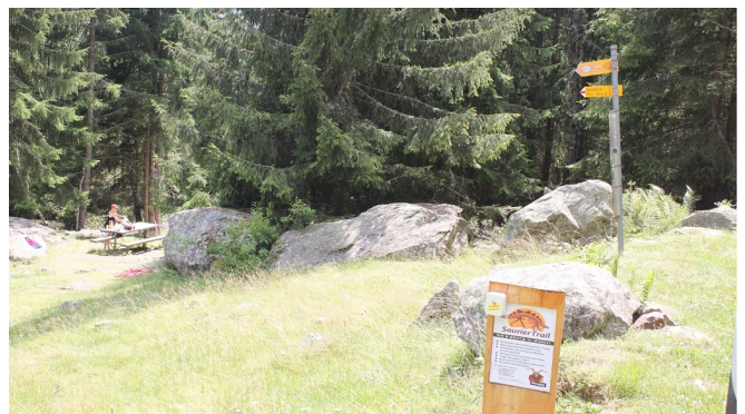
Themenweg Sauriertrail Fieschertal - Feuerstelle Brüchergand - Fieschertal