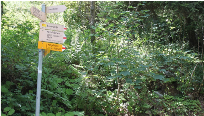
Themenweg Sauriertrail Fieschertal - Feuerstelle Brüchergand - Fieschertal