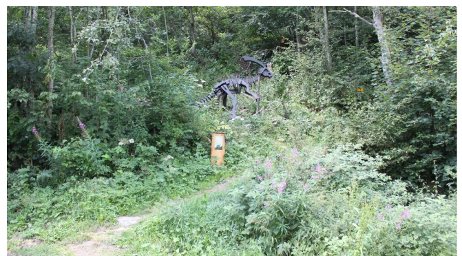
Themenweg Sauriertrail Fieschertal - Feuerstelle Brüchergand - Fieschertal