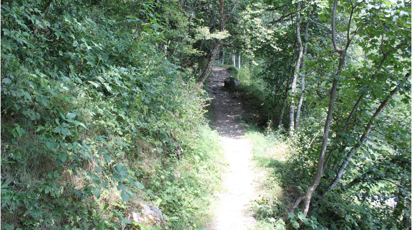
Themenweg Sauriertrail Fieschertal - Feuerstelle Brüchergand - Fieschertal