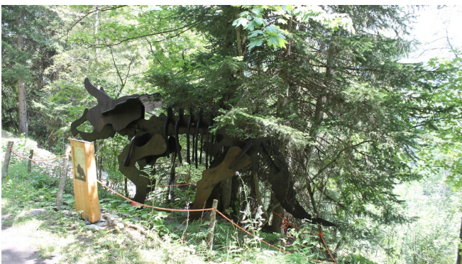
Themenweg Sauriertrail Fieschertal - Feuerstelle Brüchergand - Fieschertal