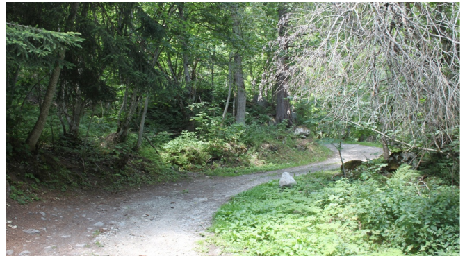
Themenweg Sauriertrail Fieschertal - Feuerstelle Brüchergand - Fieschertal