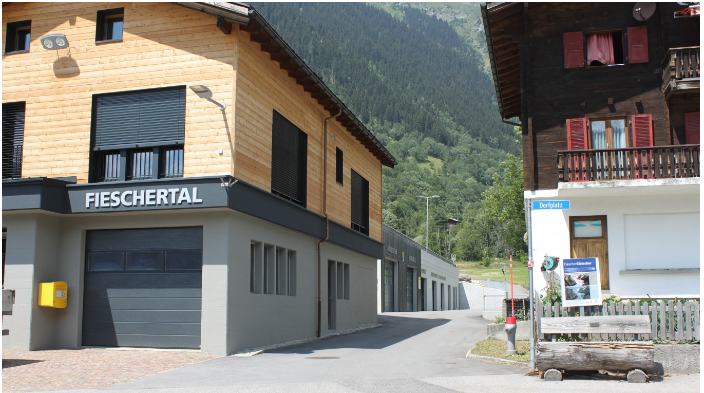
Themenweg Sauriertrail Fieschertal - Feuerstelle Brüchergand - Fieschertal