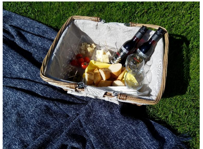
Picknickkorb, Angebot variierend, Beispielkorb

Wir erkunden unsere Sammlungswerke aus dem jeweiligen Land. Dauer der Führung: circa eine Stunde. Jeweils sonntags und donnerstags um 11 Uhr :