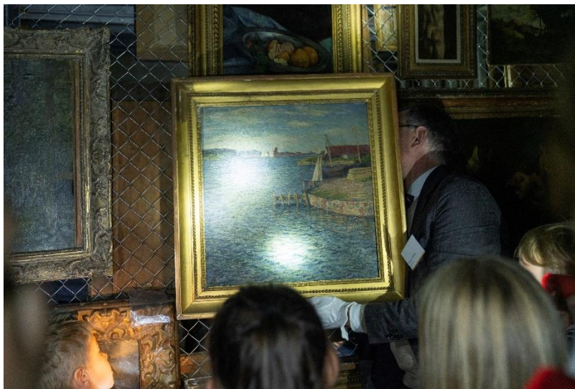
Führung im Depot des Kunstmuseums

Themenführungen für Reisefans, Kunst-Tüten für kleine und grosse Kreative und Touren durch das kühle Depot im Untergrund für Kunstliebhaberinnen und -liebhaber.