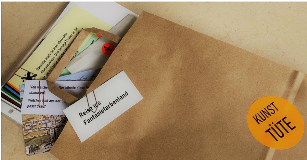
Kunst-Tüte: Reise ins Fantasiafarbenland

Die Kunst-Tüte für Kinder und Familien ermöglicht Reisen ins Fantasiafarbenland, ins 17. Jahrhundert oder durch «Getas Universum». Diese drei Kunst-Tüten beinhalten Anregungen für den Museumsbesuch, Rätsel für die ganze Familie, Gestaltungsideen und Materialien um zuhause kreativ zu werden sowie weitere Überraschungen.