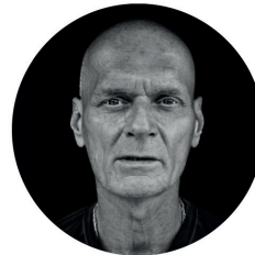
NICK YARRIS Former death row prisoner

«Even in the age of the Internet, nothing can replace the intimacy of a human face, a human voice. This project brings words and faces, me at a time and a world of strangers who, by learning those names, these faces, are strangers no more. Very loveable and very necessary.»