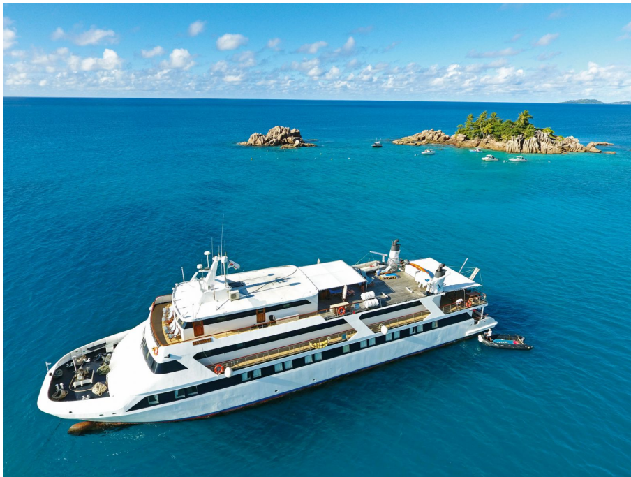
Auf der neuen Kombi-Reise Seychellen steuert Vögele Reisen im Indischen Ozean mit der Motoryacht M/Y Pegasus unberührte Inselnatur an.