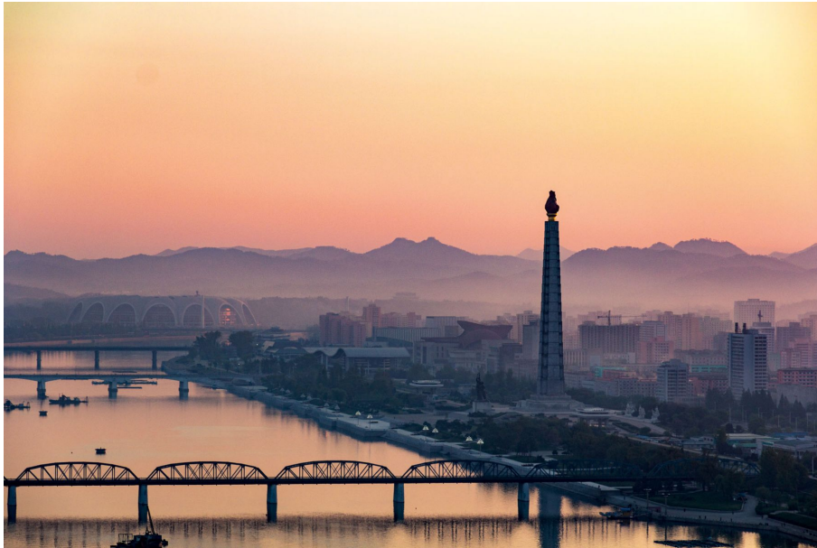
Nordkorea und seine Hauptstadt Pjöngjang gehören zu den herausragenden Reise- seneuheiten von Vögele Reisen für 2019.