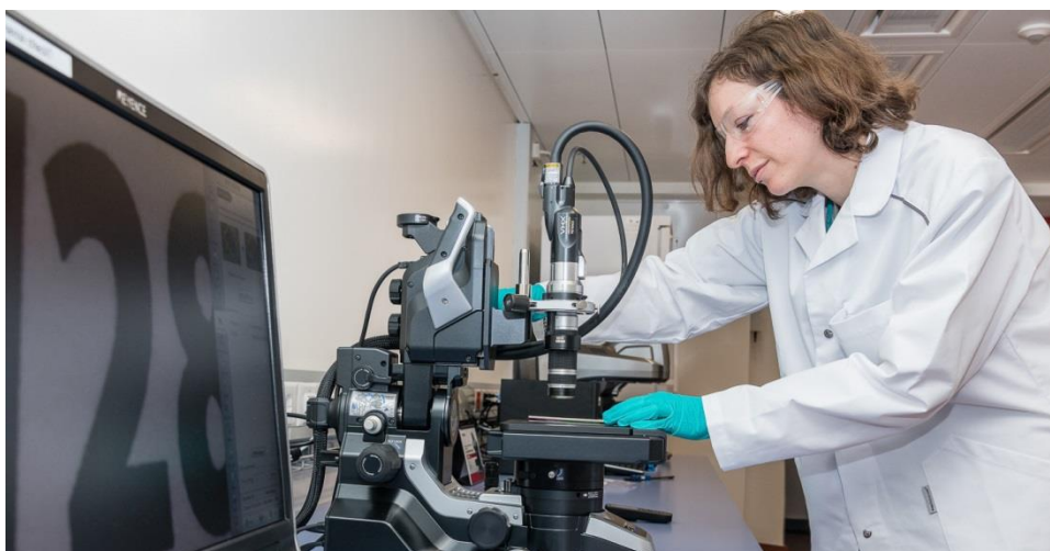
Dans le Centre de Recherche et Développement de MSD à Schachen dans le canton de Lucerne, les cas suspects de contrefaçons de médicaments sont examinés dans le laboratoire forensique récemment ouvert.