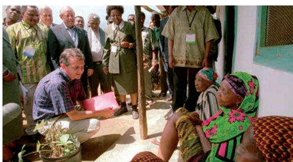
Des coopérations largement soutenues permettent de résoudre les problèmes de santé les plus urgents dans le monde entier.