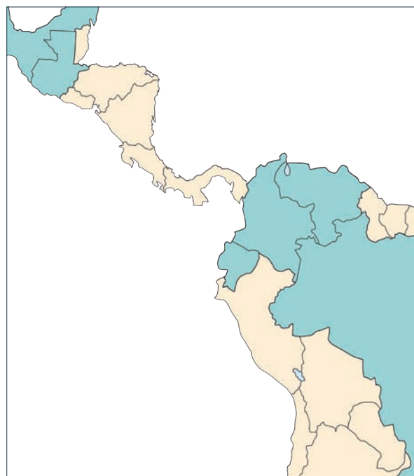
Régions de propagation de la cécité des rivières en Afrique et Amérique du sud (droits aux photos avec Merck & Co., Inc., N.J., USA).