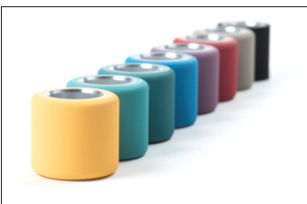
Saurer Accotex Pressfit Bezüge - Prozesssicherheit beim Ringspinnen