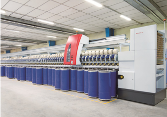
Saurer Schlafhorst Autocoro 8 Quantensprung beim Rotorspinnen