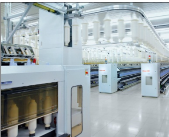
Saurer Zinser 351 Ringspinnmaschine mit Automationsanlage