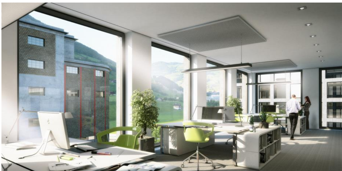
Der Nova Brunnen Business-Lifestyle der Zukunft: modernste Infrastruktur in urtümlicher Umgebung mit bester Verkehrsanbindung.