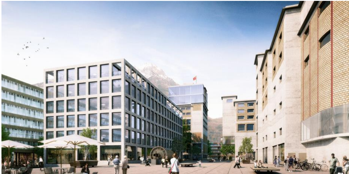
Der Attractor – das Herzstück von Nova Brunnen – wird etappenweise ab 2016 bezugsbereit sein.