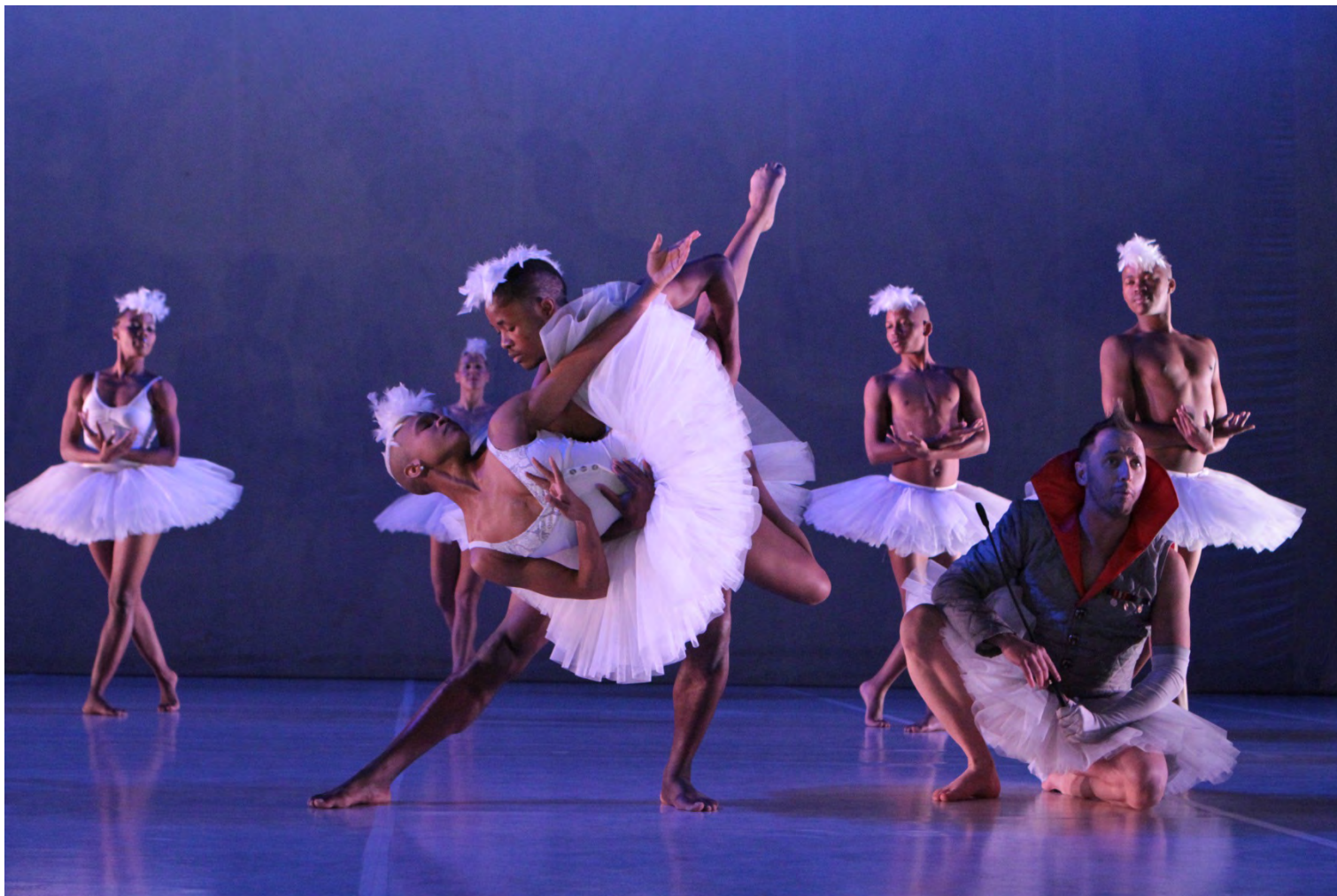
Swan Lake

Le Lac des Cygnes à l'africaine: une réinterprétation humoristique d'un grand classique