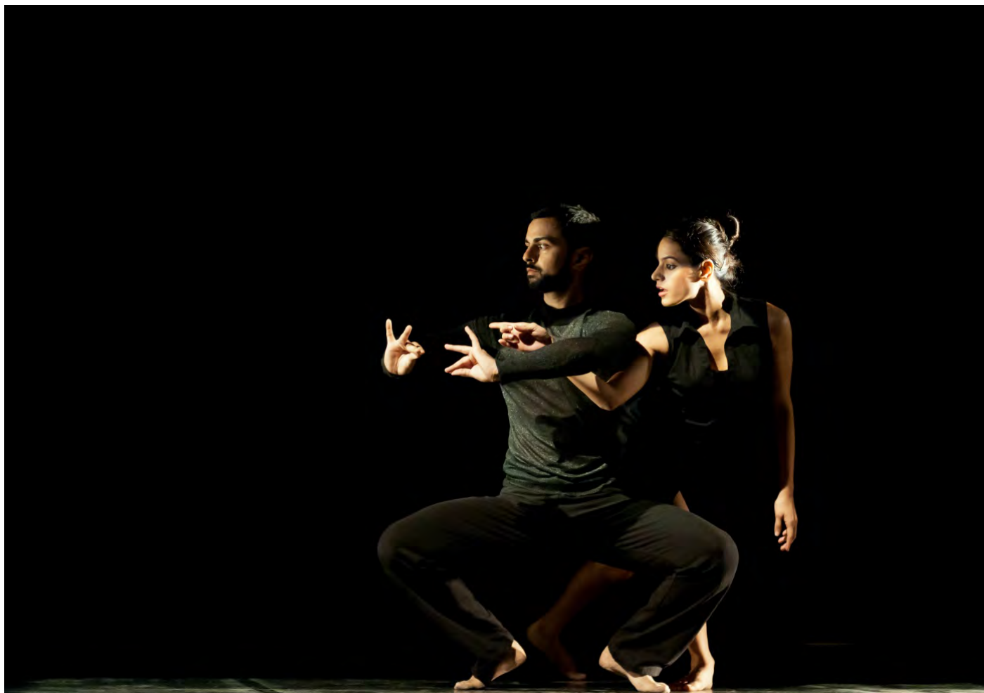
Inhabited Geometry © Desmond Roberts

Espaces indiens: entre concept multimédia et danse contemporaine