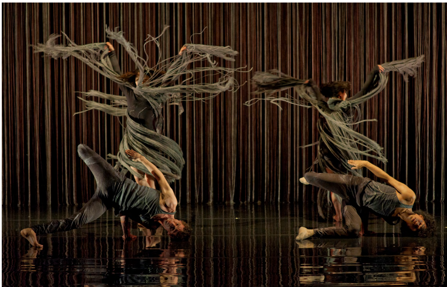
Yo Gee Ti

Une fable fantasmagorique – tissée de fils et de danse