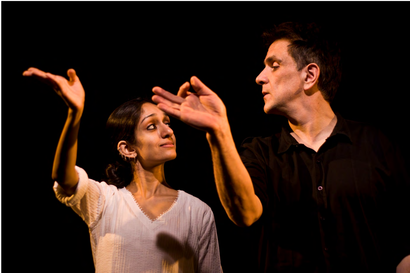
SAMA - I Can Try

Des pas indiens, des rythmes européens: un duo tout en métaphores et métamorphoses