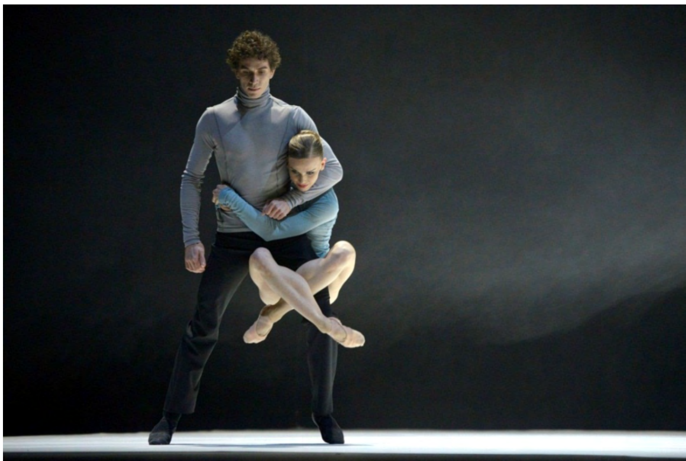
Ballett Zürich © Bettina Stoess

Trois premières très attendues dans un univers inexploré situé entre corps et imagination