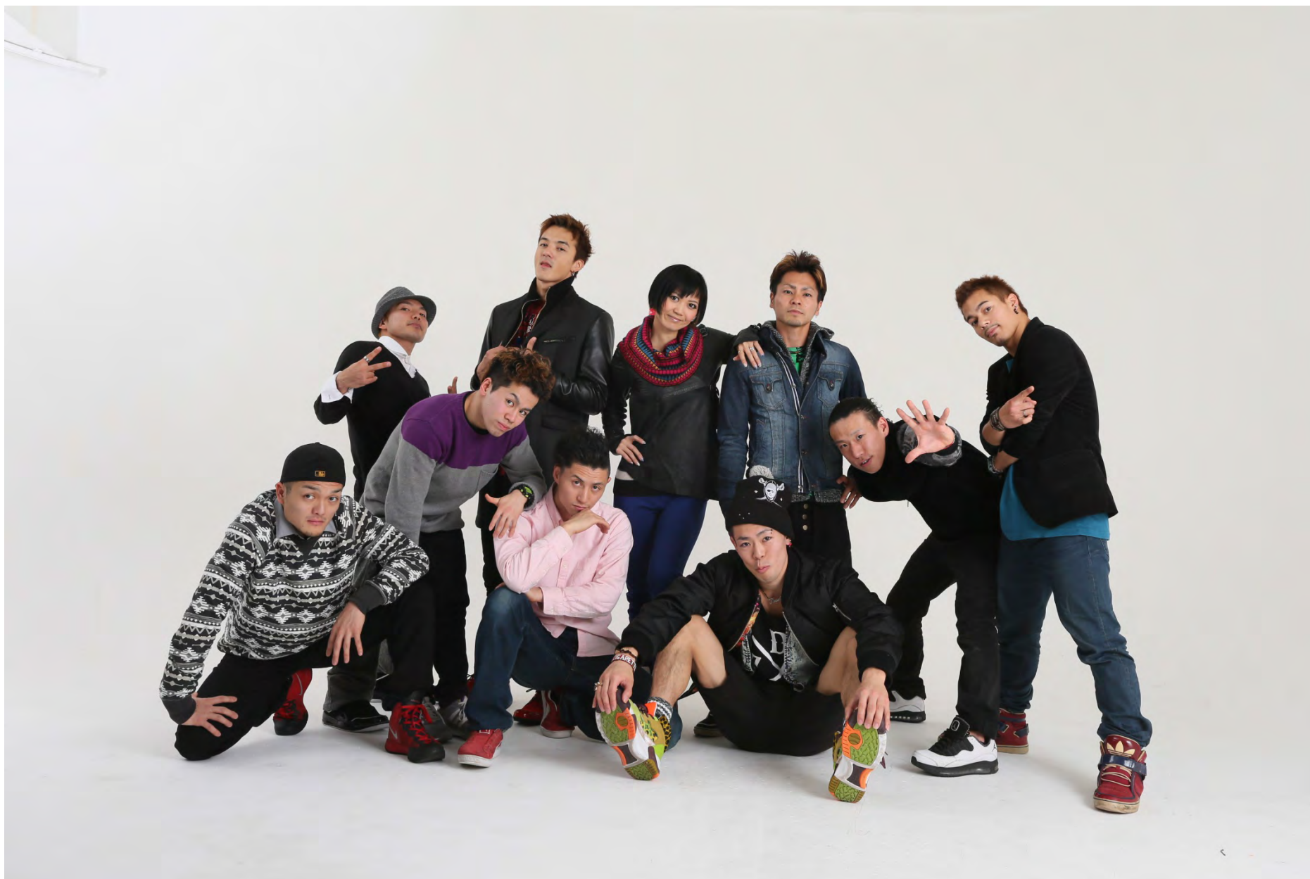
Mortal Combat © Murakami Takeshi

Hip-hop d'Ouest et d'Est – un mélange explosif