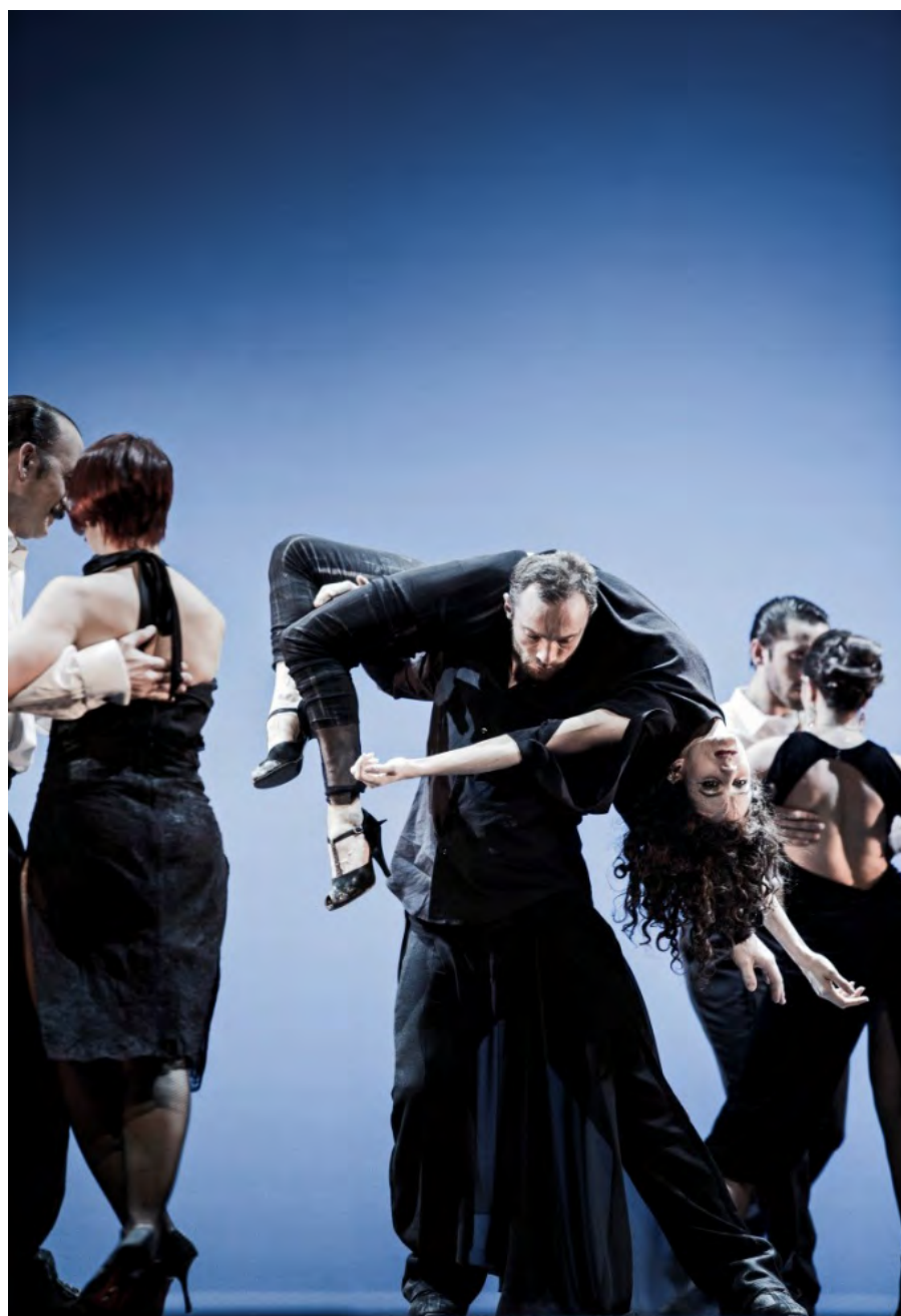
mjlonga

Dans mjlonga , cinq couples de danseurs argentins rencontrent un couple de danseurs contemporains de Belgique. Dans l'ode au tango de Sidi Larbi Cherkaoui, les danseurs tournoient à l'unisson pour dessiner de leurs pas des ornements infinis, tisser des guirlandes de mouvements lyriques, danser à deux dos à dos, changer de partenaire ou créer de toutes nouvelles formations. Le chorégraphe belge fait revivre l'atmosphère et l'émotion si typique du tango devant des images colorées et animées de la ville de Buenos Aires. Avec mjlonga , Cherkaoui – qui s'est toujours senti à l'aise entre différentes cultures – trouve une nouvelle patrie: le tango. Il propose une chorégraphie chargée de passion, de sensualité et de mélancolie – le tout accompagné d'une musique d'exception.