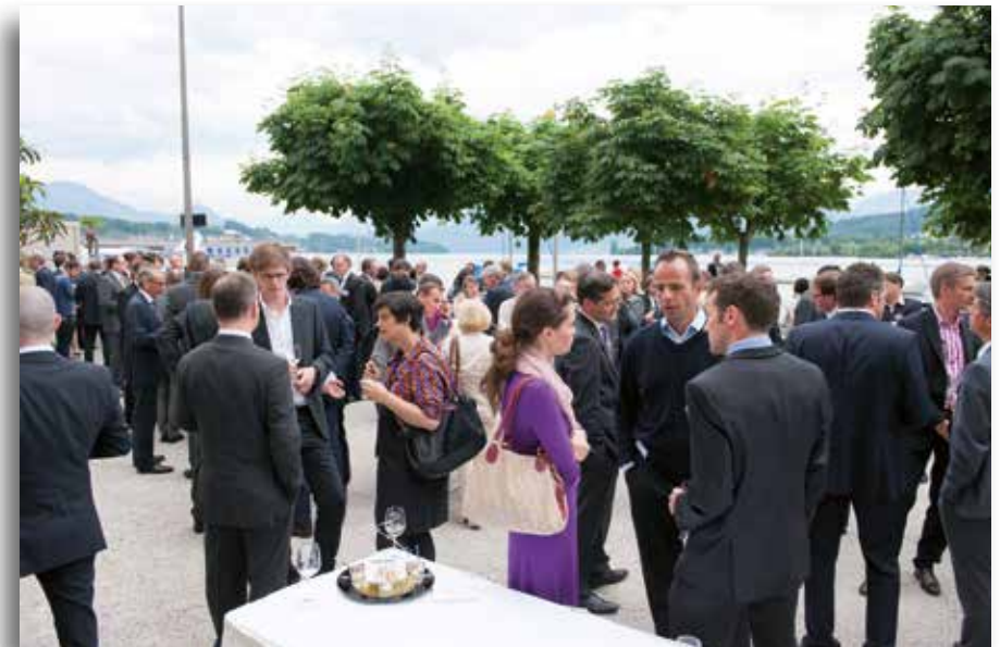
Apéro vor dem Dinner direkt am Vierwaldstättersee beim Casino Luzern.

Tel. 056 221 10 10 www.swissmediaforum.ch