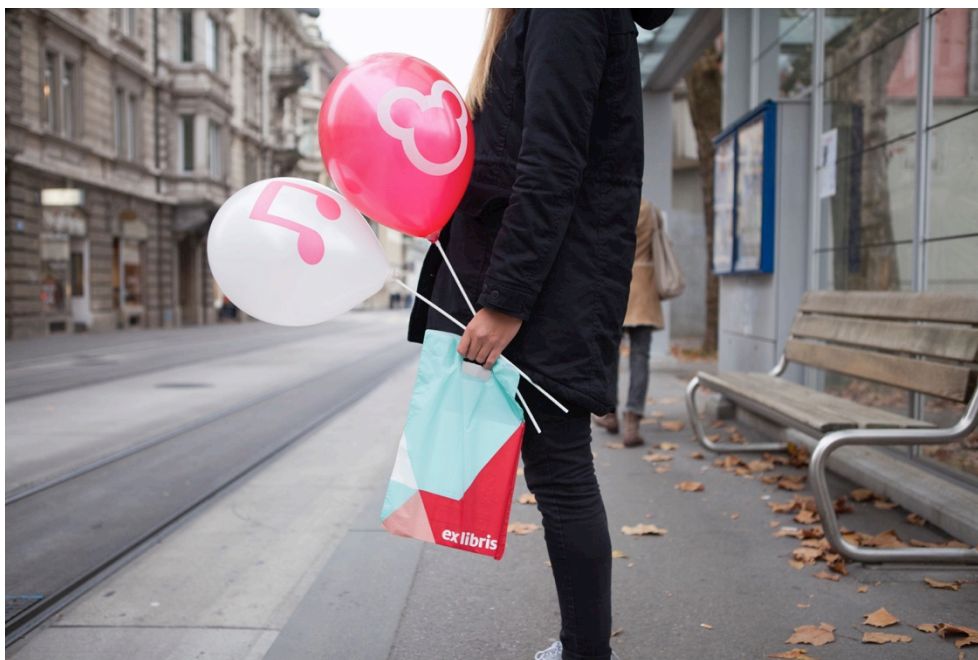
Die Kunden tragen ab August die neue Ex Libris nach Hause.

Sämtliche Fotos stehen in hochauflösender Qualität zum Download bereit unter http://www.exlibris.ch/_medien/bilder-medienmitteilung-25juni.zip