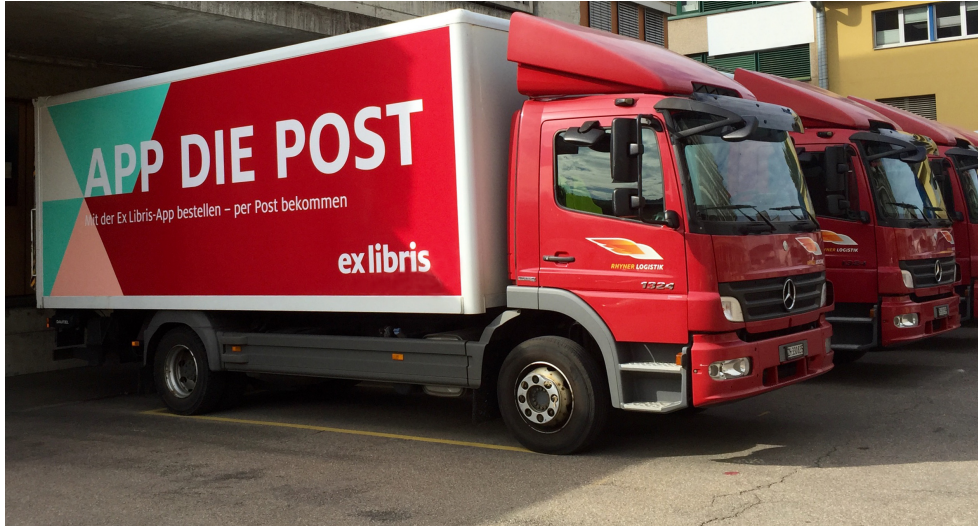
Ex Libris setzt auch auf der Strasse auf die frische Gestaltung und eine neue Ansprache.