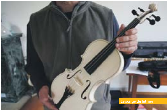
Le songe du luthier

En présence du réalisateur Christophe Ferrux