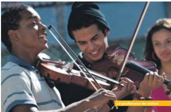
Le professeur de violon