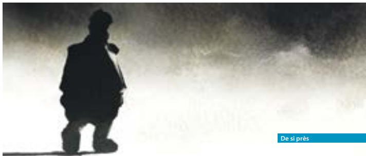
De si près

Mention spéciale contre la violence et l'intolérance, Festival international du court-métrage, Berlin 2009