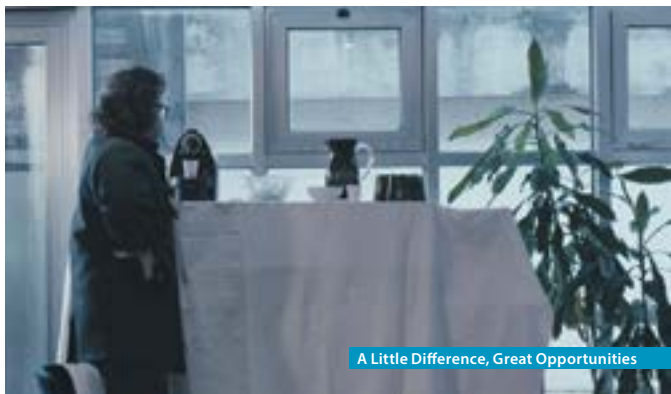
A Little Difference, Great Opportunities

Un homme vient se présenter pour un poste de travail. Tout commence par un café.