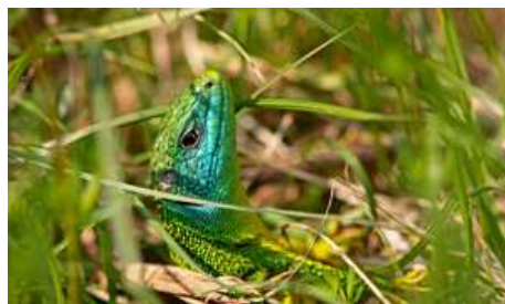
File Image 4: delinat-institut_4

Une multitude des fleurs attire les insectes utiles.