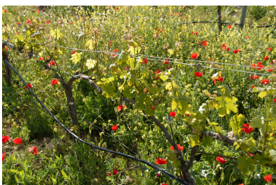
File Image 3: delinat-institut_3

Une multitude des fleurs attire les insectes utiles.