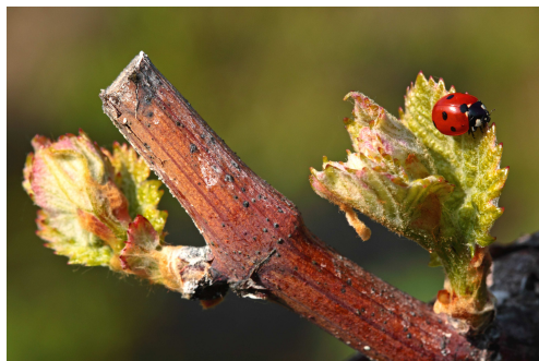
File Image2: delinat-institut_2

La vie dans le vignoble en haute biodiversité.