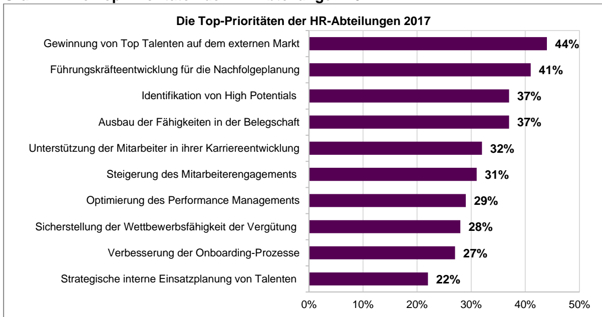
Grafik 2: Die Top-Prioritäten der HR-Abteilungen 2017