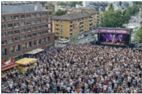
Visualisierung City Beats Kloten