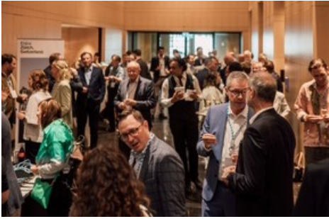
Generalversammlung Zürich Tourismus