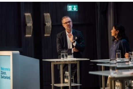
Generalversammlung Zürich Tourismus