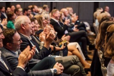
Generalversammlung Zürich Tourismus