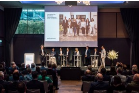
Generalversammlung Zürich Tourismus