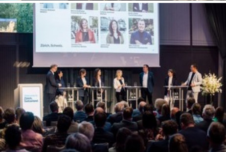
Generalversammlung Zürich Tourismus