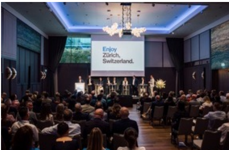
Erfolgreiche 141. Generalversammlung von Zürich Tourismus