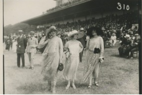
Rennbahnfotografie. Fotograf: Georges Royer, 1922. Sammlung Textilmuseum St.Gallen