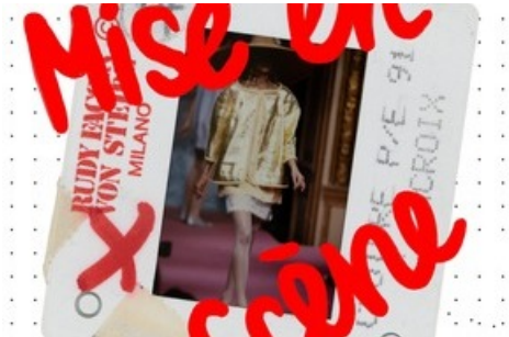
Key Visual „Mise en Scène. Modelfotografie von der Belle Époque bis heute“ mit einer Laufstegfotografie von Rudy Faccin von Steidl, 1991.