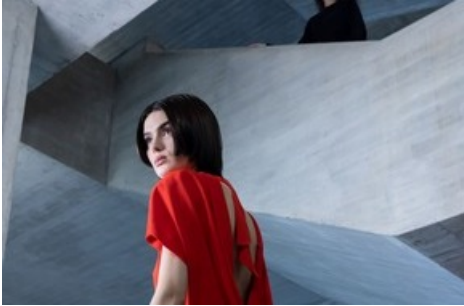
Modelfotografie aufgenommen 2022 anlässlich des 100-jährigen Jubiläums des Schweizer Haute-Couture-Labels Akris im Treppenhaus der Universität St.Gallen, einem Brutalismus-Bau des Schweizer Architekten Walter M. Förderer.