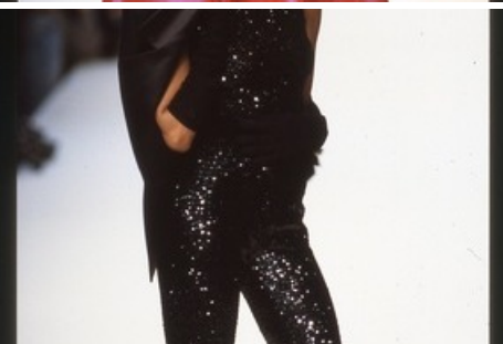
Präsentation der Givenchy-Kollektion 92/93 mit Stoffen des St.Galler Textilunternehmens Jakob Schlaepfer. Fotograf: Rudy Faccin von Steidl, 1992. Sammlung Textilmuseum St.Gallen (Schläpfer-Sammlung).