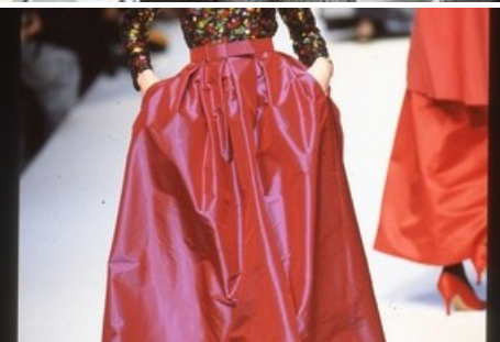
Präsentation der Givenchy-Kollektion 92/93 mit Stoffen des St.Galler Textilunternehmens Jakob Schlaepfer. Fotograf: Rudy Faccin von Steidl, 1992. Sammlung Textilmuseum St.Gallen (Schläpfer-Sammlung).