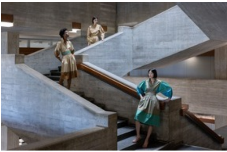
Modelfotografie aufgenommen 2022 anlässlich des 100-jährigen Jubiläums des Schweizer Haute-Couture-Labels Akris im Treppenhaus der Universität St.Gallen, einem Brutalismus-Bau des Schweizer Architekten Walter M. Förderer.