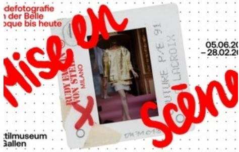
Key Visual „Mise en Scène. Modefotografie von der Belle Époque bis heute“ mit einer Laufstegfotografie von Rudy Faccin von Steidl, 1991.