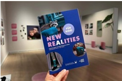
Selbstständig für Familien mit Kinder: Booklet mit Rätseln, Suchspielen und mehr in «New Realities»