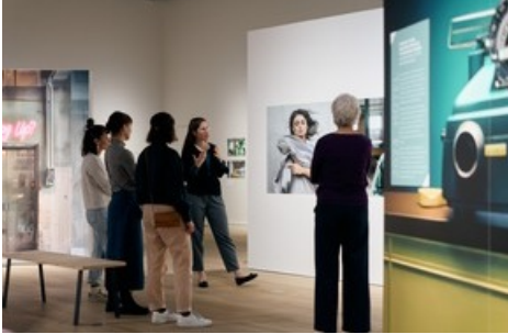
Sonntag, 14 Uhr: Führung in «New Realities»