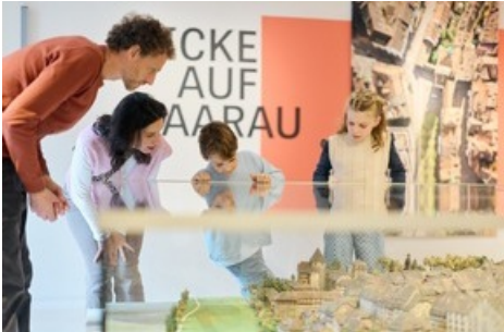
Samstag, 14-16 Uhr: Führungen in vielen Sprachen in der Dauerausstellung und «New Realities»