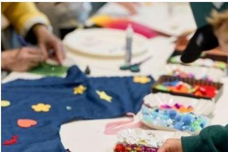
Alles glitzert und glänzt: Samstag, ab 14 Uhr Kaleidoskop-Bastelatelier

Diese Meldung kann unter https://www.presseportal.ch/de/pm/100085663/100939593 abgerufen werden.