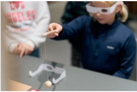
Samstag, 25. April: Workshop zu 3D-Sehen und mehr - mit Freiwilligen der Sammlung Kern