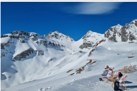
Gemütliche Stunden bei der Pizolhütte / Pizolbahnen

Diese Meldung kann unter https://www.presseportal.ch/de/pm/100085818/100939376 abgerufen werden.