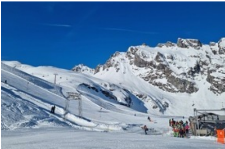
Reger Betrieb auf den Sesselbahnen und Skiliften über die Ostertage / Pizolbahnen