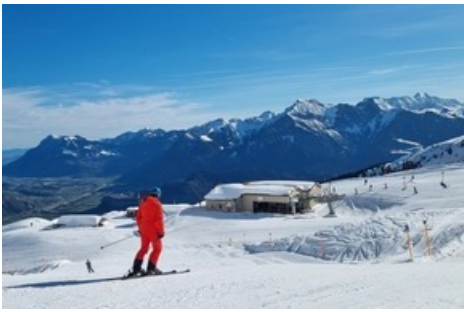
Frühlingsskifahren in seiner schönsten Form / Pizolbahnen