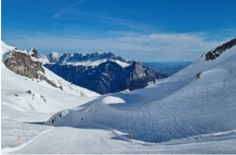
Perfekte Pisten zum Saisonschluss / Pizolbahnen