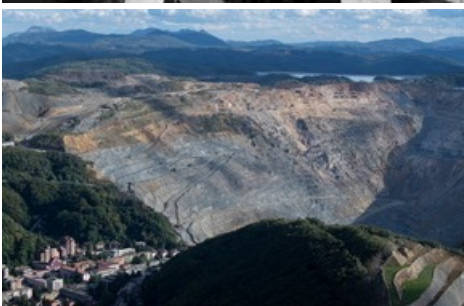
Serbien, Majdanpek vom Berg Starica aus gesehen, hinten die Southpit Mine des chinesischen Betreibers Zijin am 18.9.2022.