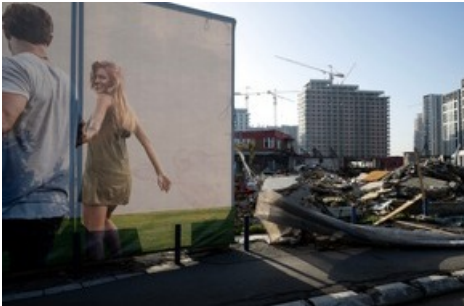
Belgrad, 26. November 2024. Damit die saudischen Investoren die neue Stadt «Belgrade Waterfront» hochziehen können, muss der alte Busbahnhof weichen.