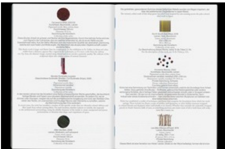
Publikation Sheila Hicks: a little bit of a lot of things, gestaltet von Hubertus Design, herausgegeben von Hatje Cantz Verlag