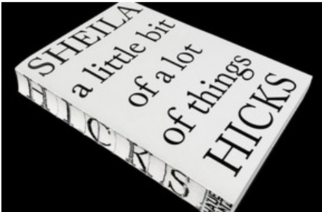
Publikation Sheila Hicks: a little bit of a lot of things, gestaltet von Hubertus Design, herausgegeben von Hatje Cantz Verlag