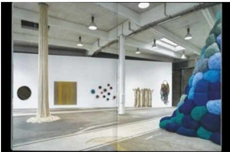
Publikation Sheila Hicks: a little bit of a lot of things, gestaltet von Hubertus Design, herausgegeben von Hatje Cantz Verlag