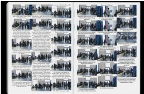
Publikation Sheila Hicks: a little bit of a lot of things, gestaltet von Hubertus Design, herausgegeben von Hatje Cantz Verlag

Diese Meldung kann unter https://www.presseportal.ch/de/pm/100059306/100938928 abgerufen werden.