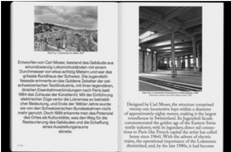
Publikation Sheila Hicks: a little bit of a lot of things, gestaltet von Hubertus Design, herausgegeben von Hatje Cantz Verlag