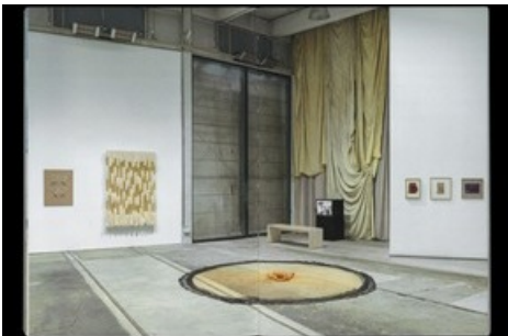
Publikation Sheila Hicks: a little bit of a lot of things, gestaltet von Hubertus Design, herausgegeben von Hatje Cantz Verlag