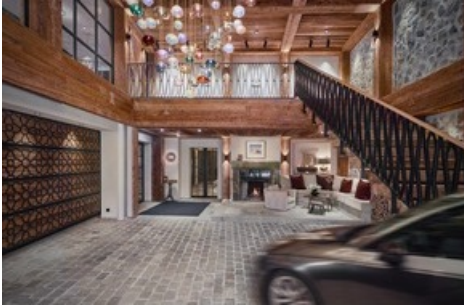
Spektakuläre Eingangshalle