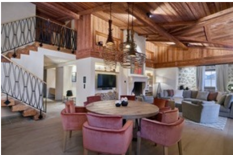
Raum für gemeinsame Momente

Diese Meldung kann unter https://www.presseportal.ch/de/pm/100018582/100937272 abgerufen werden.