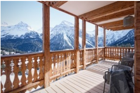
Grosszügige Terrasse mit Blick in Richtung Schanfigg