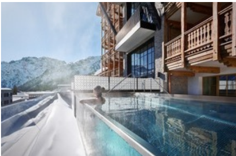
Private Infinitypools mit Aussicht