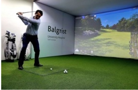
Balgrist Golf Institute: Abschlag in die Zukunft - Schwung- und Bewegungsanalyse beim golfenden Patienten.

Diese Meldung kann unter https://www.presseportal.ch/de/pm/100068217/100933330 abgerufen werden.