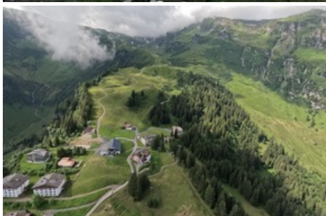
Streckenabschnitt Furt-Pizolhütte / Pizolbahnen