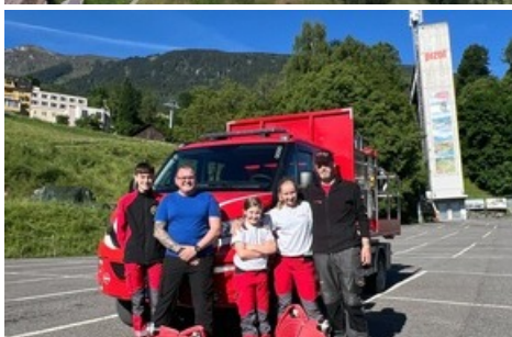
Mit Vorfreude und grosser Motivation zum Rekordversuch / Pizolbahnen