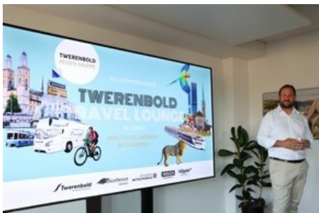
Karim Twerenbold eröffnete am 1. Juli 2025 mit einer Rede in feierlichem Rahmen in Anwesenheit von Gästen und Partnern die Twerenbold Travel Lounge.