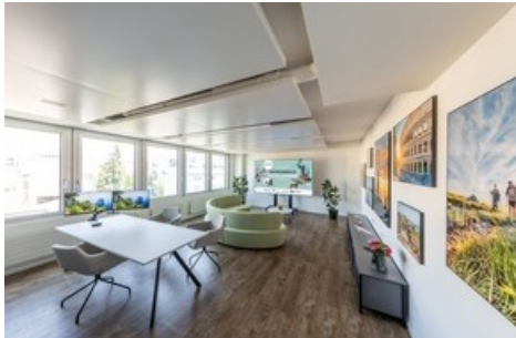
Im behaglichen Ambiente der Twerenbold Travel Lounge finden Reiseinteressierte ab sofort Inspiration und fachkundige Beratung zu den Angeboten der Twerenbold Reisen Gruppe.