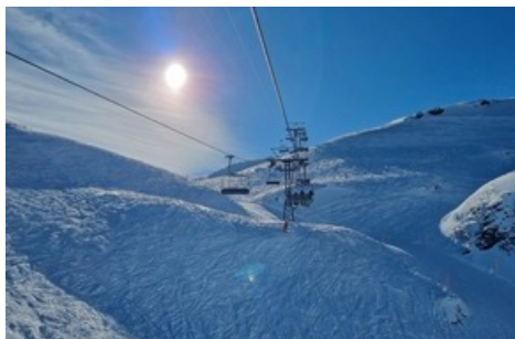
Attraktives Wintersportgebiet mit 12 Anlagen und 50 km Pistenangebot